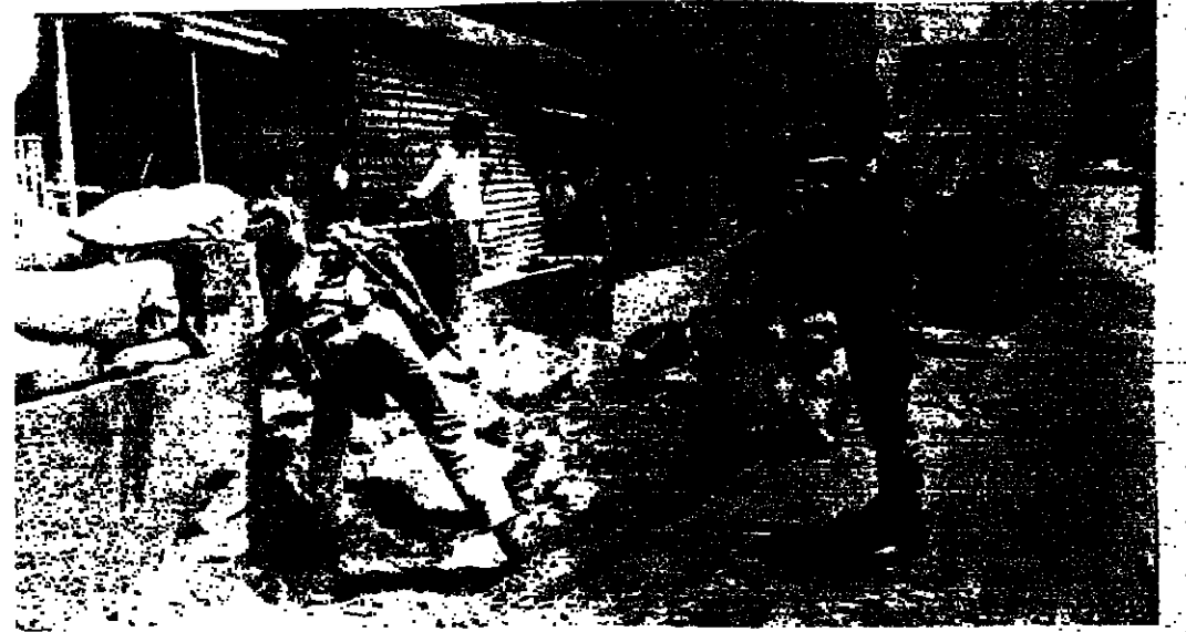
بنايا ممراس تجري ازالته نهائياً

رفضوا واصروا على ازالها الى الطريق وكان رفع كل « ممراس » يتطلب حوالي نصف ساعة من النقاش .. وحدات الجرارات بالمتارينس الصنعية تهيئ الوصول الى الكفرة - وحملت السحاكات على تنظيف الشوارع من الرمل ..